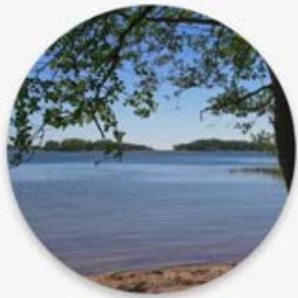
Long Beach at Störsvik