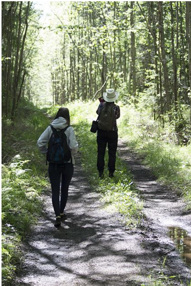
Kuva 10 Retkeilijät.