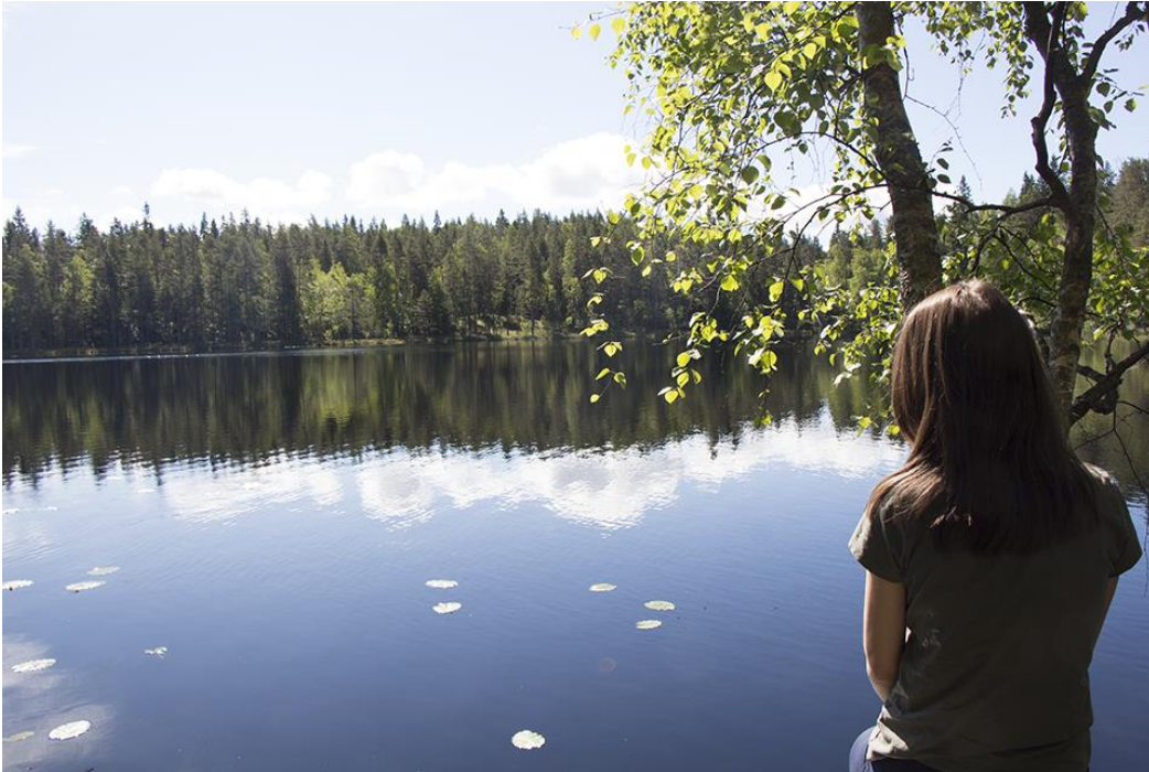
Kuva 4 Lammenrannalla.