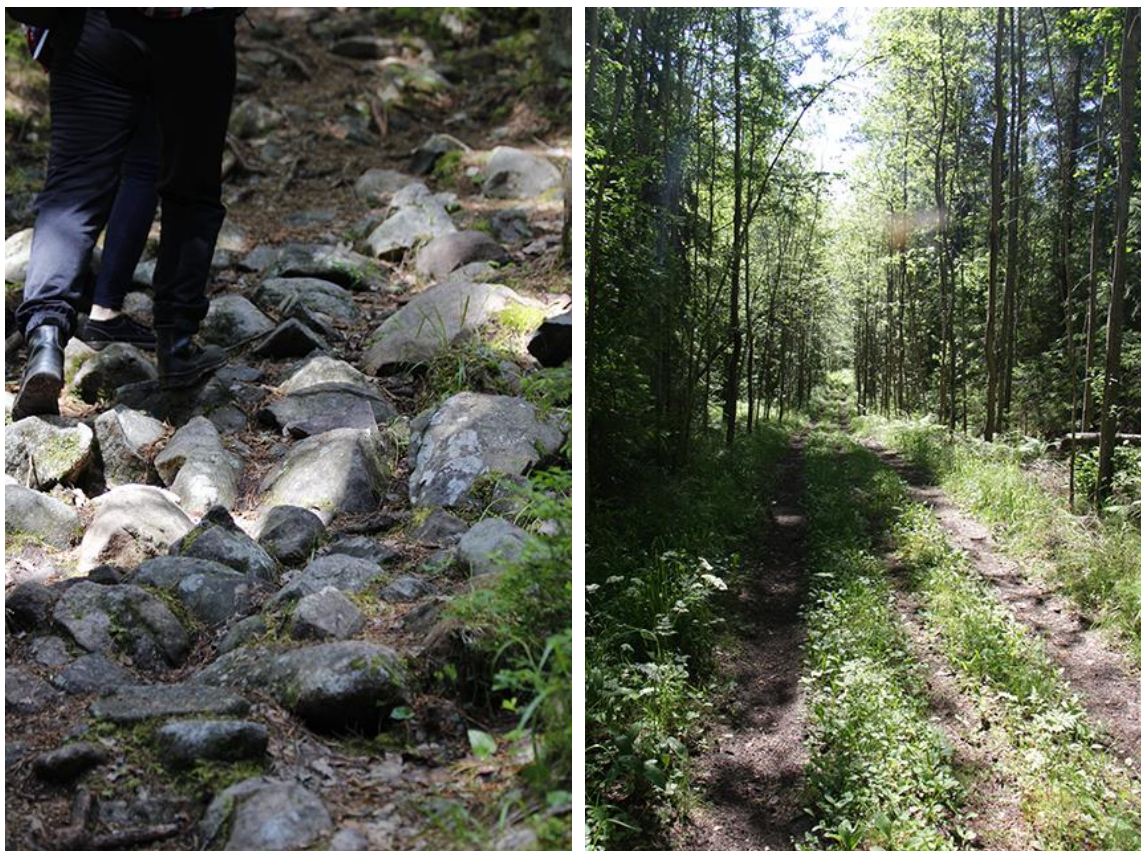
Kuva 2 Kivikkoista polkua. Vanhaa tienpohjaa.

helppoa polkua, maasto muuttuu lammenrantaa ja nuotiopaikkaa lähestyessä hieman soiseksi, kosteikolla on pitkospuita. Nuotiopaikalta satamaan jatkaessa kävellään helppoa ja leveää vanhaa tiepohjaa joka on suhteellisen jyrkkä, mutta tien ollessa vanhaa tasattua autotietä, sitä on helppoa kävellä. Tien lopussa siirtyessä polulle joka vie satamaan on vaativa jyrkkä polku, jota pitkin myös palataan takaisin päin. Vuoren päälle kiivetään takaisin samaa vanhaa tienpohjaa ja nuotiopaikalta jatketaan keskivaativalle kivikkoisemmalle ja mäkisemmälle osuudelle kuusimetsän keskellä. Reitin loppuosassa on myös pitkospuita. Reitti on helppo muutamaa keskivaativaa osuutta lukuun ottamatta, joten se sopii hyvin lapsiperheille.