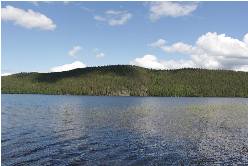
Kuva 3 Vaarunvuoret vastarannalta katsottuna.

Alueella on paljon erilaisia kasveja ja lintuja, joita voi bongata. Vaarunjyrkän alueella kävijöitä on haastatellun mukaan paljon ja saapuminen maantieltä on helppoa. Päijänteen näkyminen vuorelta ja kohteen hiljaisuus ovat alueen valtteja sen moninaisuuden lisäksi. Asuustarinoita tiedettiin löytyvän Suomisen Pekan kirjasta nimeltä Pössy-viki.