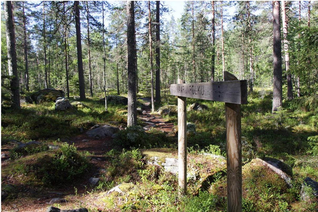
Kuva 8 Kyltti reitillä.

Opastuskyltit ovat osittain hyvin kuluneet. Luontoaiheiset kyltit reitillä ovat myös aikansa eläneet. Natura 2000- suunnitelmassa on päätetty lähtöpistekyltin poistamisesta, mutta tätä ei vielä ainakaan 2017 ole tehty. Reitien lähtöpisteessä tulee olla hyvä, selkeä opastaulu jossa on kartta, tietoa reitin sisällöstä ja haasteellisuudesta - joka on helppo. Muutamia polun haarautumiin on myös lisättävä kyltti tai parempi värimerkintä selventämään kulkureittiä. Ajotieltä opasteet ovat hyvät.