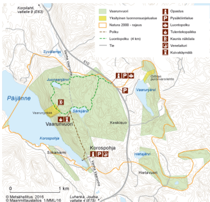
Kuva 1 Kartta Vaarunvuorten reitistä