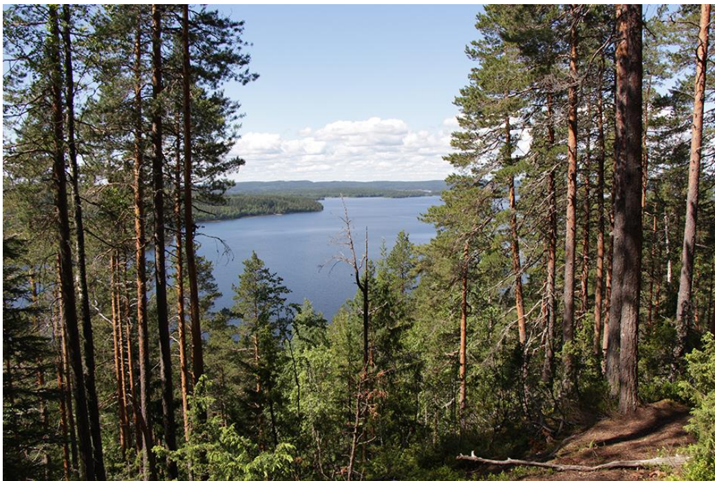
Kuva 9 Maiseman eteen kasvavien puiden karsinta.

Maisema Päijänteelle vuoren päältä uhkaa piiloutua kasvavien puiden taakse, minkä vuoksi jonkinmoista raivausta tulisi ennakoivasti tehdä tai rakentaa paikalle näköalatorni.