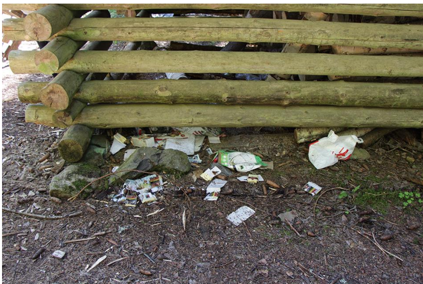
Kuva 7 Puuvajan ympäristön roskaisuus.

Roskankeräyksen puuttuessa on tärkeää muistuttaa retkeilijän vastuusta kuljettaa roskat pois alueelta sekä lähtöpisteessä, kuin taukopaikallakin. Jätehuollon järjestämistä olisi myös hyvä harkita. Alueelle on helppo päästä, joten alueella liikkuu monenmoista retkeilijää. Nuotiopaikan roskaisuudesta päätellen useampikin kävijä on roskansa jättänyt puuliiteriin, josta tuuli ja eläimet pääsevät niitä kuljettamaan pitkin metsää.