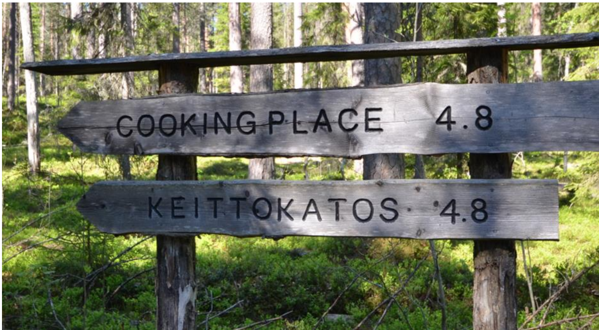
Kuva 9 Englanninkielisten termien kirjoitusasujen tarkastaminen