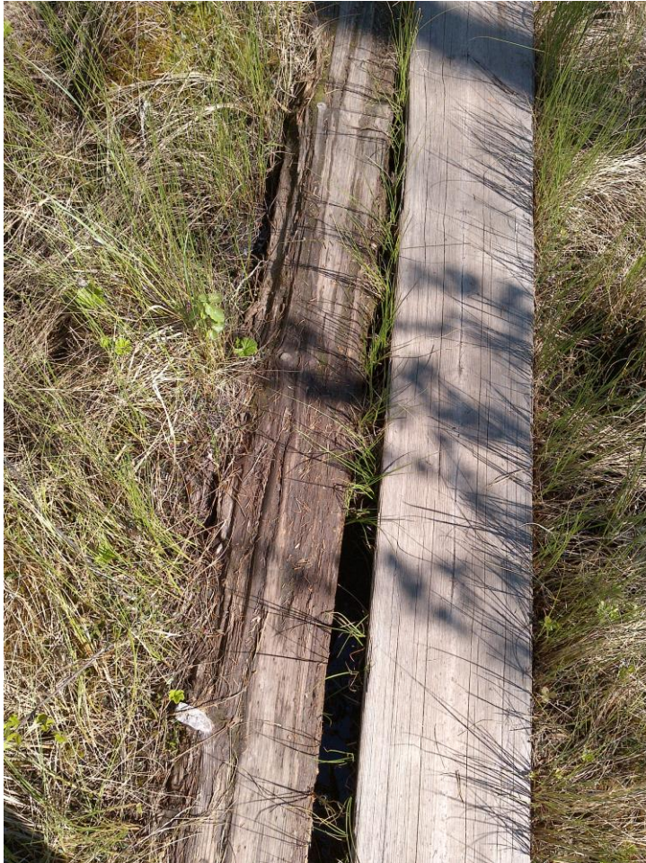
Kuva 8 Märkä pitkospuu Kotajärven lenkillä

märkiä. Nämä tulisi vaihtaa kuiviin. Suolikon jyrkänteeseen toivottiin portaita kulun helpottamiseksi. Lisäksi levähdyspaikkoja eli penkkejä saisi olla enemmän, esimerkiksi Kotanevan niemekkeeseen sekä Suolikon rinteeseen.