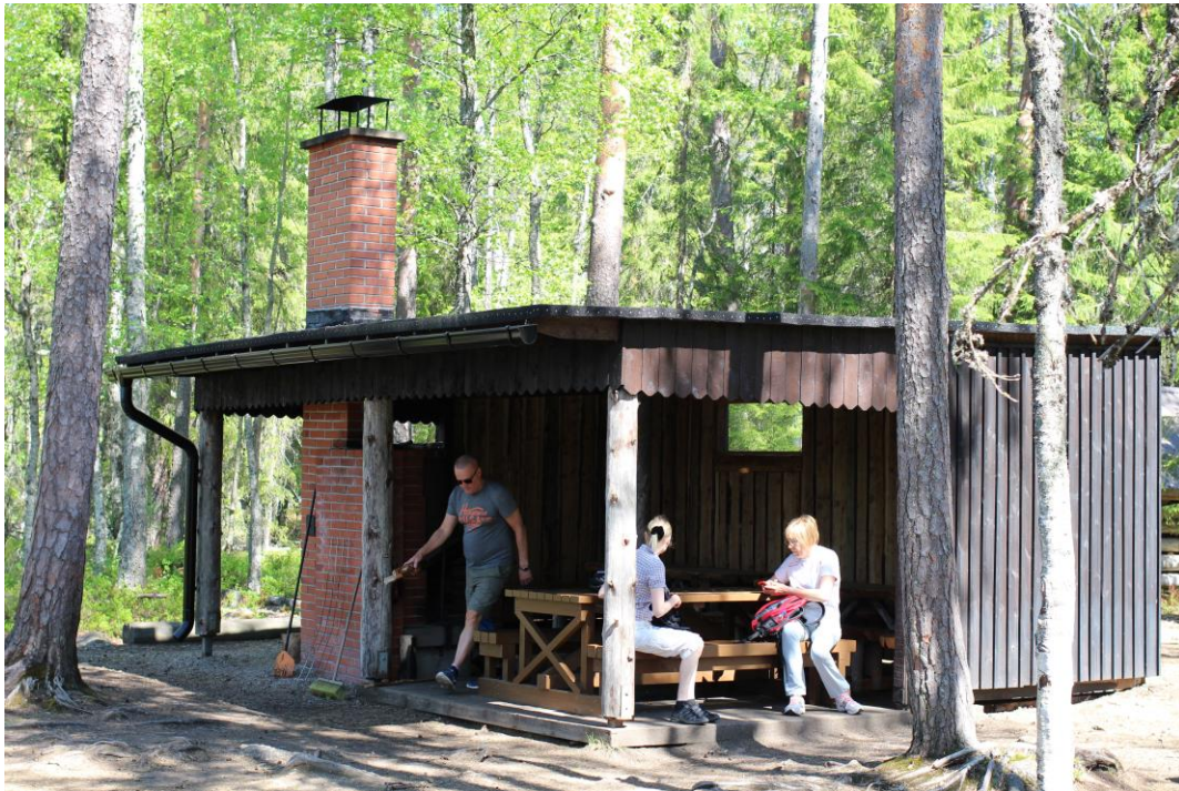
Kuva 3 Kotajärven keittokatos