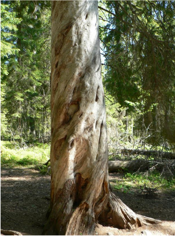
Kuva 5 Iso vanha puu