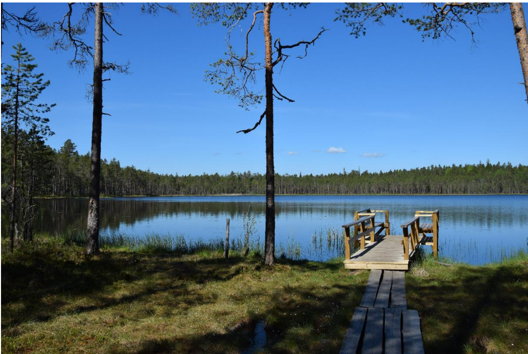
Kuva 7 Kotajärven uimapaikka