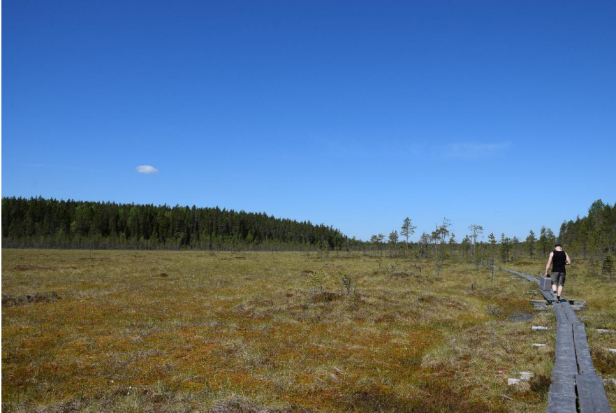
Kuva 6 Avosuota