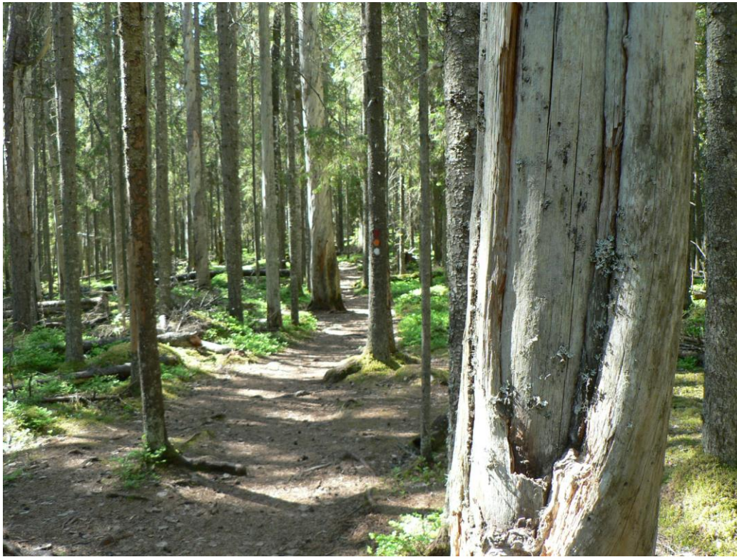
Kuva 2 Pyhä-Häkin aarnimetsää ja keloputia

Muita kansallispuistoon liittyviä erityispiirteitä ovat kansallispuiston omaleimaisuus ja ainutlaatuisuus, jotka näkyvät esimerkiksi koskemattomuutena, äänettömyytenä ja yleisenä rauhallisena ilmapiirinä. Alueen maastoa kuvattiin myös lappimaiseksi.