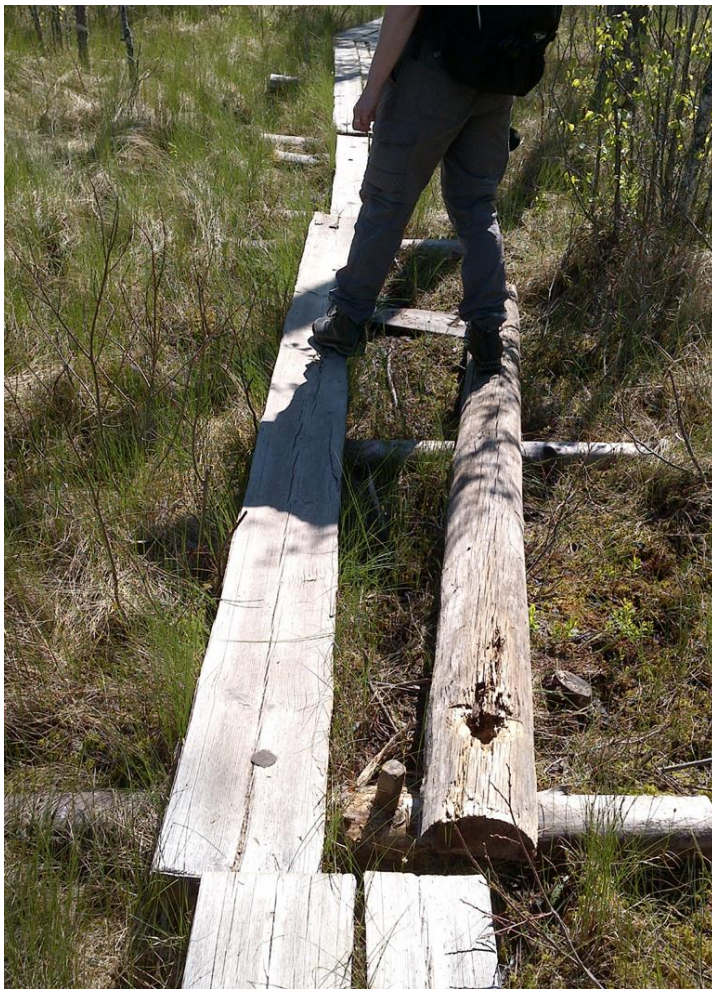
Kuva 7 Pitkospuut kaipaavat paikoittain korjaamista

Kotajärven lenkin pitkospuut ovat yleisesti ottaen hyvässä kunnossa, mutta reitin loppupuolella suo-osuuksilla olevat pitkospuut ovat osittain huonossa kunnossa. Näissä paikoissa pitkospuiden tapit ovat kohonneet, minkä takia jotkut lankut ovat irti. Rikkinäiset lankut tulisi vaihtaa ja tapit kiristää. Yhdessä kohdassa myös pitkokset ovat osittain veden alla ja siksi