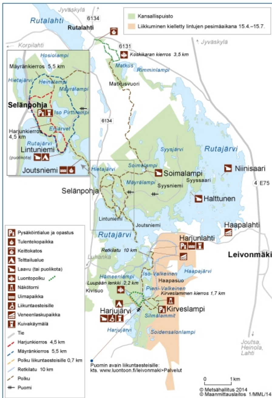
Kuva 1 Leivonmäen kansallispuiston kartta