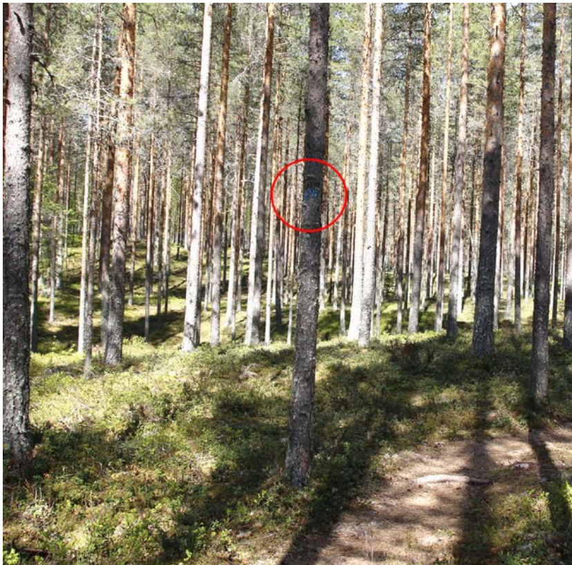
Kuva 16 Siniset maalimerkit kuluneita

Työpajassa pidettiin tärkeänä kehittää alueen opasteita ja merkintöjä. Tällä hetkellä Kirveslammen pysäköintialueella olevat opasteet sieltä lähteville poluille ovat sekavat. Koska molemmat reitit on mahdollista kiertää sekä myötä että vastapäivään, opasteviittojen olisi hyvä ohjata kummastakin suunnasta reitille. Luupään lenkin ja Kirveslammen kierroksen erkanemiskohdassa on ainoastaan haalistuneet maalimerkit, joten risteysalue kaipaisi selkeän viitoituksen. Myös reitin Luupään lenkin loppupuolella oleva pätkä kaipaa opasteita takaisin parkkipaikalle. Maalimerkit reitin varrella ovat kuluneita, eikä seuraavaa merkkiä aina ole edellisen kohdalta nähtävissä. Uudelleenmaalaus olisi siis paikallaan.