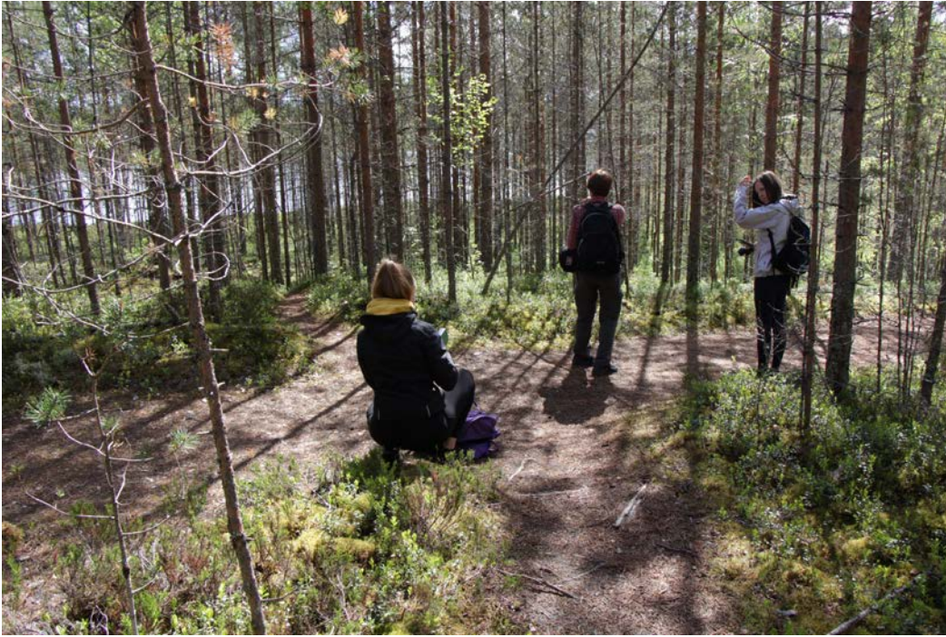
Kuva 17 Kirveslammen kierroksen alkupään risteyskohta kaipaa viitoitusta

Kartat ja maasto-opasteet eivät vastaa toisiaan. Metsähallituksen kartassa on kyllä näkyvissä esimerkiksi Harjujärven telttailupaikka sekä puolikodalla oleva huussi, mutta ilman karttaa niistä kumpaakaan ei välttämättä maastossa tajua. Huussi on piilossa liiterirakennuksessa. Sinne vievä ”sisäänkäynti” on kyllä merkitty yläparruun valkoisella maalilla, mutta selkeyden vuoksi se kaipaisi vielä oikeankin opasteen.