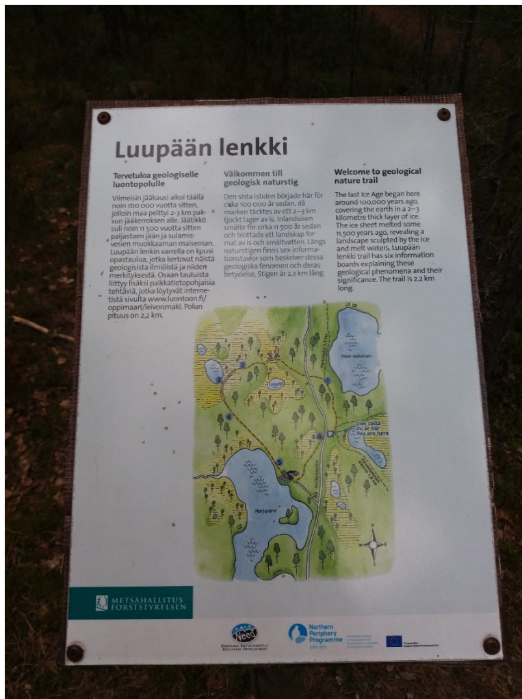
Kuva 2 Geologisen luontopolun taulu

varsinkin jyvaskyläläisten päiväretkikohteena. Kesäaikoina lähin julkisen liikenteen linja-autopysäkki on 12 kilometrin päässä Leivonmäellä. Tämän lisäksi koululaisten loma-aikoja luukun ottamatta koulukyyditykset pysähtyvät tarvittaessa Kivimäen pysäkillä. Bussiaikataulut löytyvät Matkahuollon sivuilta.