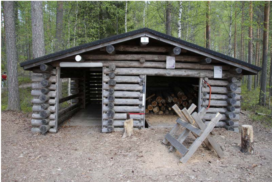
Kuva 19 Esteetön käymälä merkitty valkoisella, vaatisi myös kyltin

Työpajaan osallistuneet ehdottivat hanketta liittyen kansallispuiston tarinoiden elävöittämiseen, jotka julkaistaisiin paperiversiona sekä netissä. Reiteillä olisi myös hyvä olla sähköinen vieraskirja. Nähtävyyksien kohdalla voisi olla mobiilikohdeopasteet, jotka sisältävät kuvia, videoita sekä ääntä erilaisista teemoista. Ne voisivat kiinnittää huomion ympäröivään metsään, sen ääniin, tunnelmiin ja tuoksuihin. Myös monipuolisen linnuston voisi nostaa esiin. Reitillä olevat kyltit voisivat sisältää myös tietoa kohteesta.