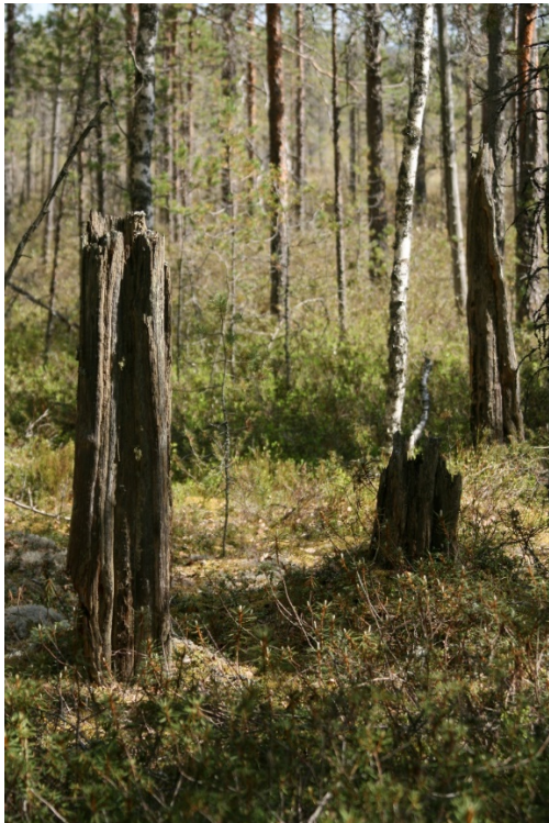
Kuva 8 Palokorot