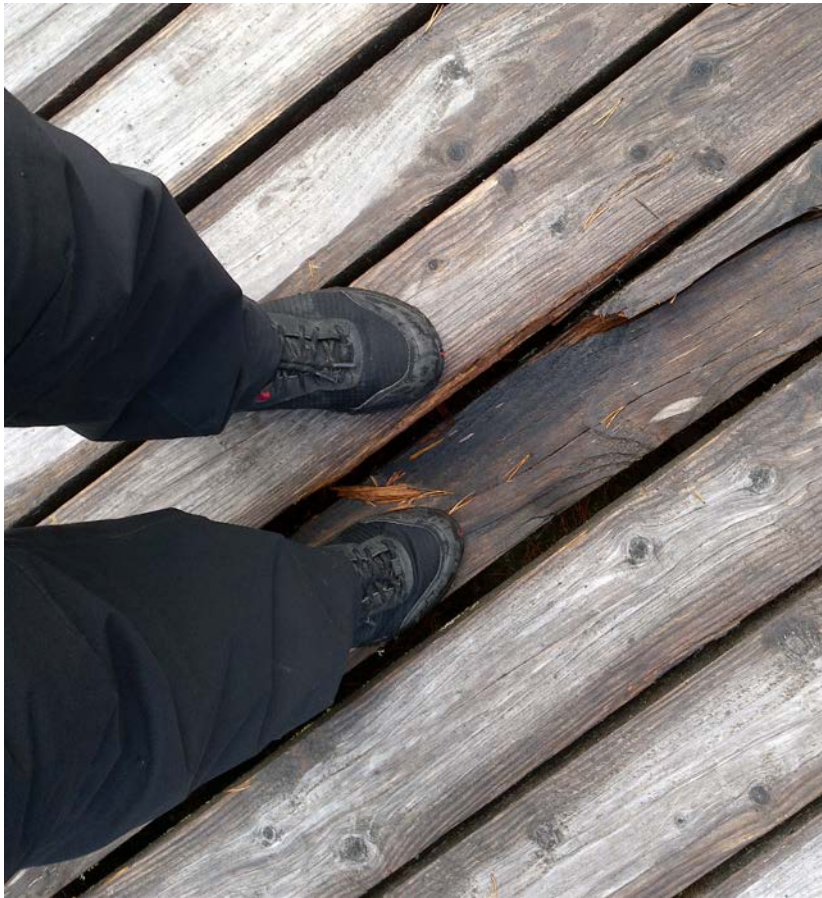
Kuva 14 Luupäänlenkin pyörätulisillalla lahoja lankkuja

Konkreettisista kehityskohteista mainittiin pitkospuiden korjaaminen (huonokuntoisten korjaaminen ja korvaaminen), niiden tapituksen kiristäminen ja pyörätulisillan uusiminen. Ainakin Kirveslammen eteläpuolella ja Luupään lenkin alussa on muutamia korjaamista kaipaavia kohtia. Erään haastateltavan mukaan Halttusen laavun purkaminen oli tarpeetonta ja laavuja voisi olla nykyistä enemmänkin. Uutta laavua toivottiin esimerkiksi Harjujärven puolikodan yhteyteen, sillä sieltä löytyy jo valmiiksi puuvaja sekä käymälä. Toiveena olisi myös, että Metsähallitus jatkaisi alueen ja reittien hyvää ylläpitoa myös tulevaisuudessa.