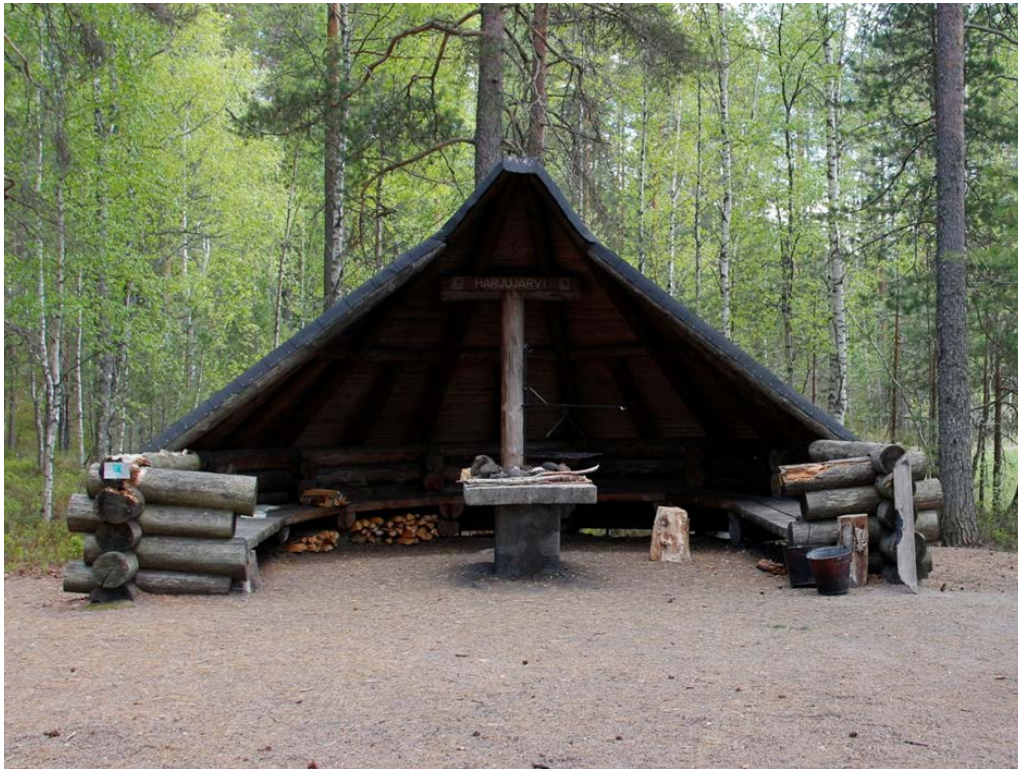
Kuva 12 Harjujärven puolikota