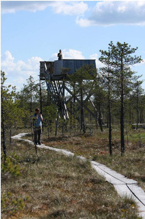
Kuva 3 Luontotorni

Leivonmäen kansallispuisto on monipuolinen retkeilykohde, ja se näyttäytyy retkeilijöille mielenkiintoisena ja erilaisena eri vuorokaudenaikoina sekä vuodenaikoina. Alue on hiljainen ja rauhallinen, ja siellä on monipuolinen linnusto. Puiston polut ovat erittäin hyväkuntoisia ja työpajan osallistajat mainitsivat erotustekijäksi myös esteettömyyden. Harjujärven puolikodalle pääsee esimerkiksi lastenvaunuilla ja pyörätuolilla. Reitit ovat pienemmillekin lapsille sopivan lyhyitä ja helppokulkuisia, mutta silti monipuolisia. Suon keskellä oleva luontotorni on erityisen hieno paikka ja erotustekijä moneen muuhun reittiin verrattuna. Leivonmäellä on talvella myös retkilatuja. Tarinoista mainittiin Havuhuuppon eli Leivonmäen ensimmäiseen asukkaaseen liittyvät tarinat.