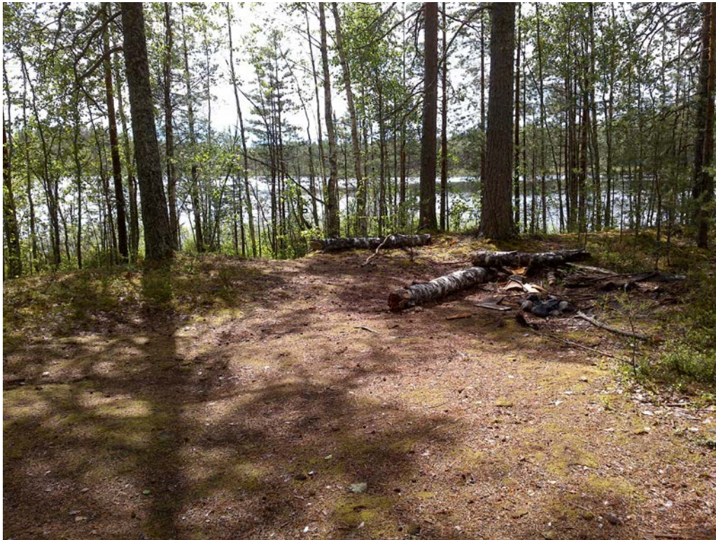
Kuva 18 Harjujärven telttapaikkaa ei ole merkitty maastoon