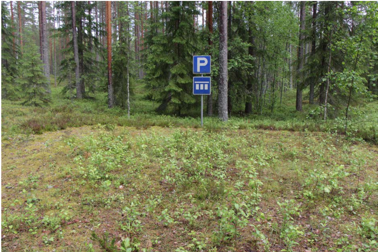
Kuva 20 Esteettömän reitin varrella olleen entisen parkkipaikan kyltti poistettava

kasvaa puustoa. Koska liikuntarajoitteiset voivat pysäköidä Harjujärven kodan viereen, tulisi tämän entisen parkkipaikan kyltti poistaa.