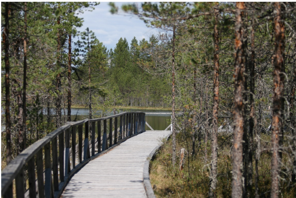
Kuva 5 Esteetön osuus Turasenlammille