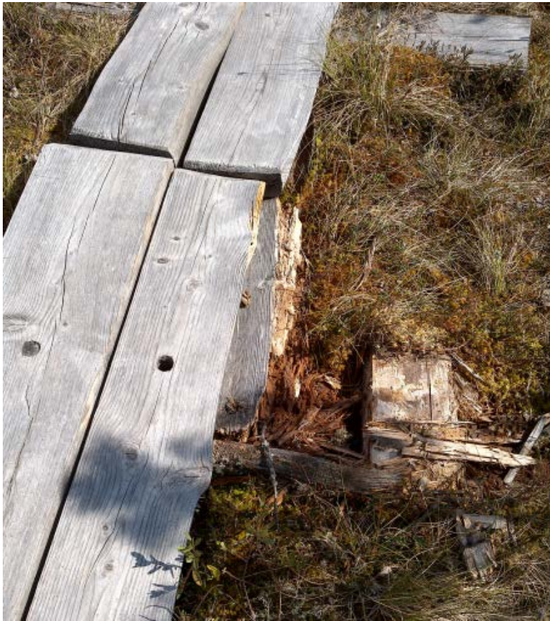
Kuva 15 Kirveslammen eteläpuolella huonokuntoisia pitkospuita

Patikkareitille pitää tehdä reittiluokitus ja sitä pitää tuotteistaa ja markkinoida. Tätä varten reitiltä otetaan kuvia ja videoita. Leivonmäen retkiladulla pitäisi olla oma lenkki myös suosuudelle. Toisaalta toivottiin myös pidempää vaellusreittiä, joka olisi rengasreitti ja yhdistäisi kansallispuiston pohjois- ja eteläosat.