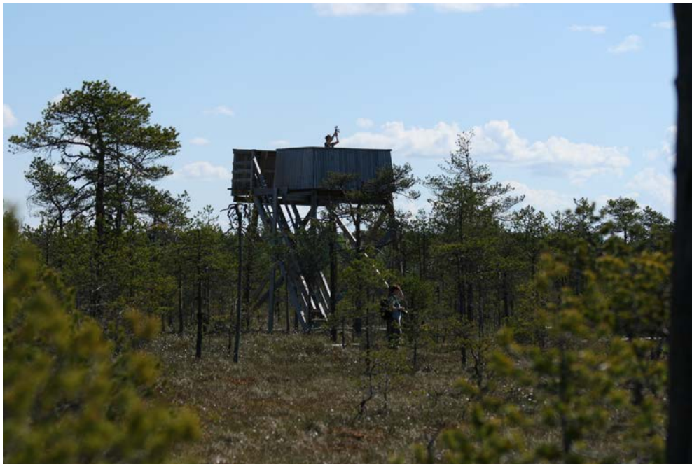
Kuva 9 Luontotorni