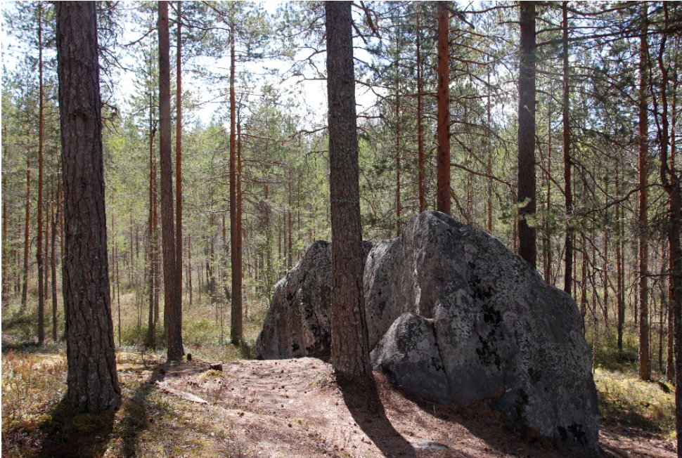
Kuva 10 Siirtolohkare