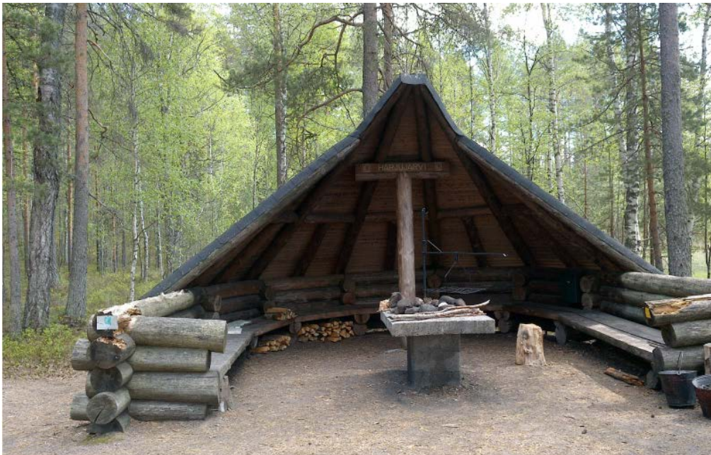
Kuva 13 Puolikodan kaidehirret kaipaavat kunnostusta

Metsähallituksen mukaan erityisesti Luupään lenkillä on kunnostustarpeita, esimerkiksi Harjajärven taukopaikkarakenteet, jotka edellyttävät investointirahoitusta. Puolikota on huonossa kunnossa, esimerkiksi kaidehirsissä on lahoja kohtia, jotka on korjattava. Lisäksi Luupään lenkin kävely-/pyörätuolisilla rikkinäinen lankku tulisi vaihtaa.