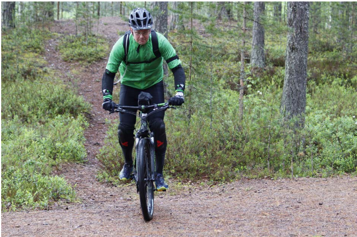
Kuva 21 Leivonmäen kansallispuistossa voi harrastaa myös pyöräilyä