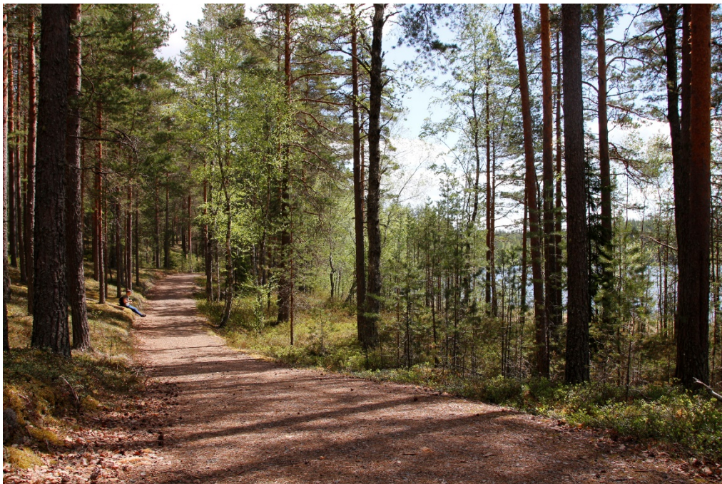
Kuva 4 Luupään lenkin esteetön osuus