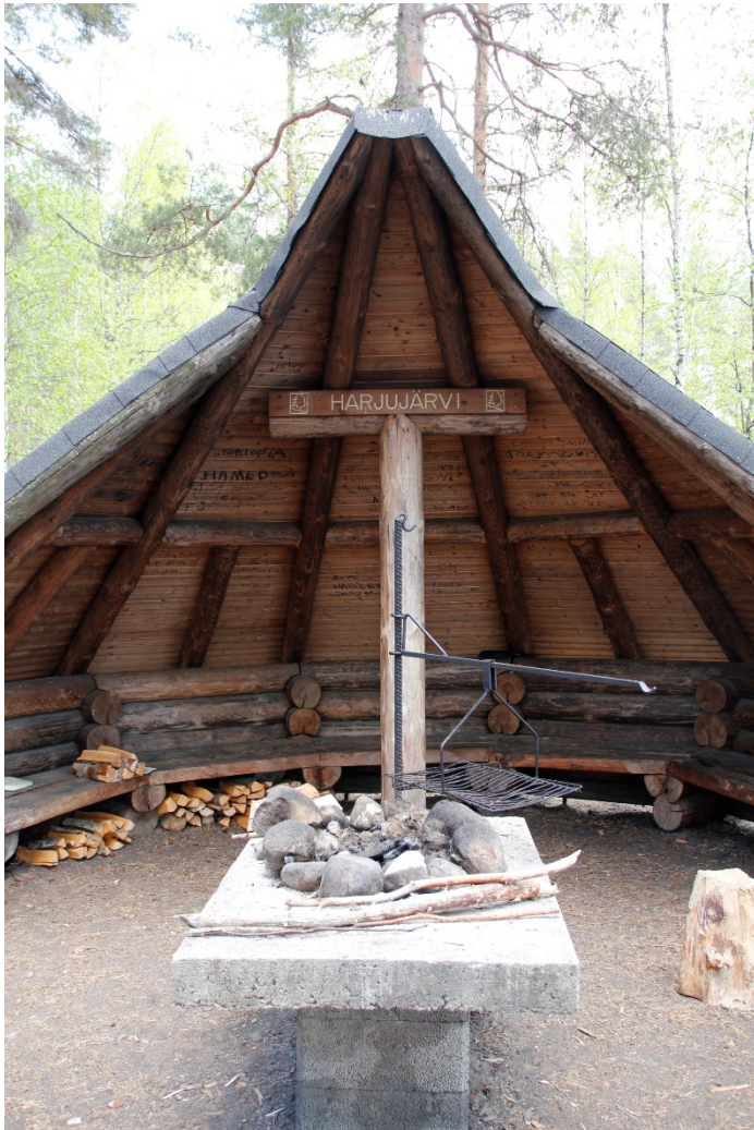
Kuva 6 Harjujärven esteetön puolikota

Myös haastateltavilta kysyttiin alueen erityispiirteistä. Haastateltavat nostivat esiin hyvin pitkälle samoja asioita, kuin mitä työpajassa mainittiin. Monipuolisuuden, hiljaisuuden ja nähtävyyksien lisäksi haastatteluissa mainittiin alueen vesistöt. Eräs haastateltavista näkee, että yhteys Päijänteeseen erottaa Leivonmäen kansallispuistoalueen muista vastaavista. Myös mahdollisesti tulevaisuudessa toteutuva biosfäärialue ja alueella vallinnut metsätalous mainitaan. Lisäksi Joutsniemi nousee keskusteluissa esille poikkeuksellisen hienona ja potentiaalisena paikkana.