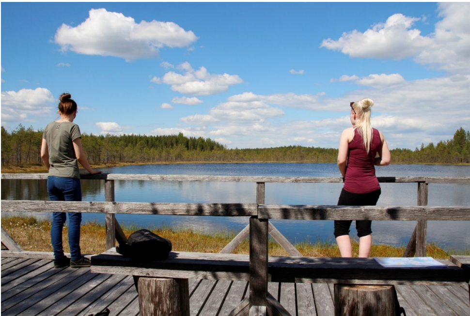
Kuva 11 Turasenlammen kuvausspotti