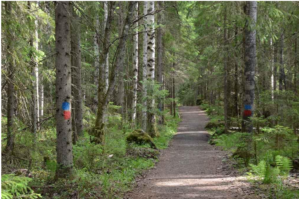
Kuva 3. Jätkien polkupyöräura ja reittimerkintöjä.