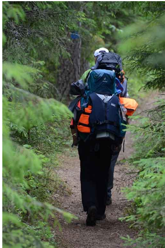
Kuva 7. Nuotiopaikalla ja retkeilijät.