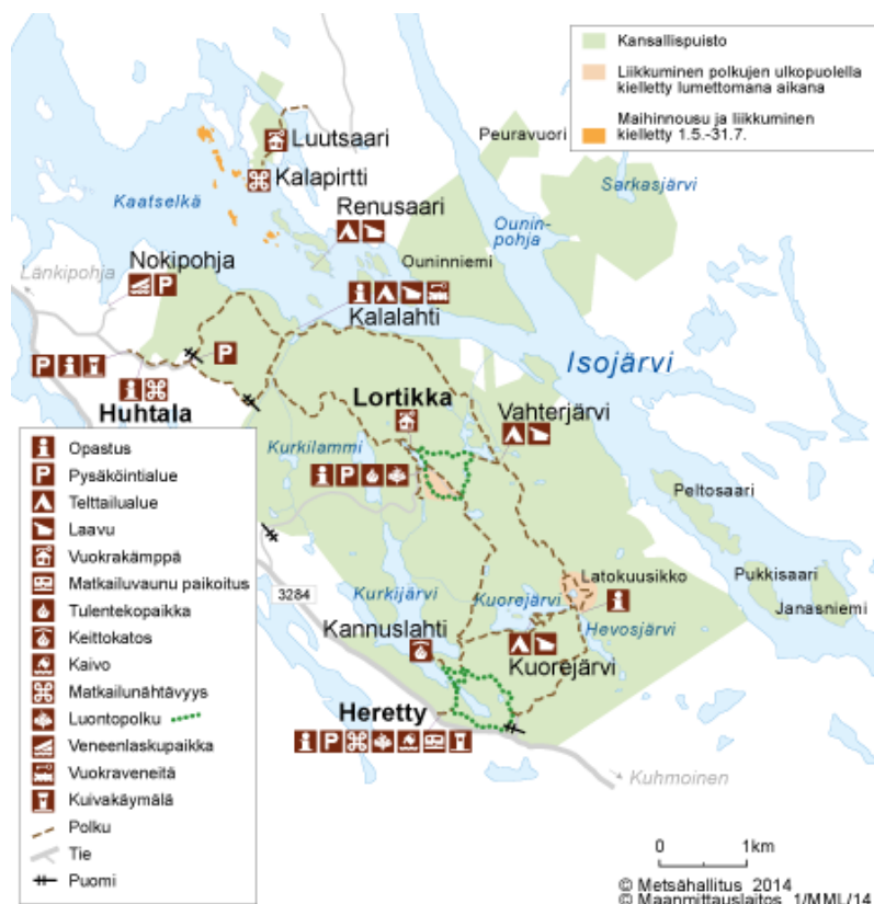
Kuva 1. Kartta Isojärven alueesta.

Isojärven reittiprofiloinnin työpaja järjestettiin Isojärvellä 20.4.2017. Työpajassa oli 13 osallistujaa. Työpajan tavoitteena oli löytää alueen erityispiirteet, erotustekijät ja päänähtävyydet sekä kehitystarpeita ja mahdollisia haastateltavia henkilöitä.