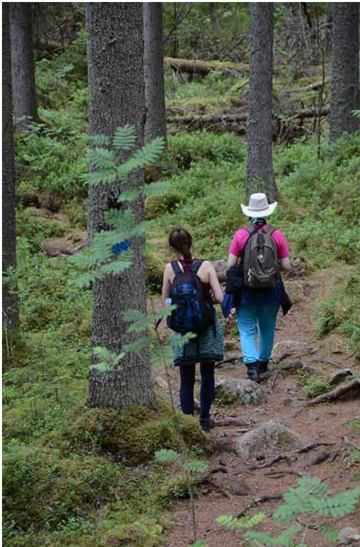
Kuva 6. Päiväretkeilijät.

Kiertosuunta on päätetty olevan vastapäivään, jolloin haastavin osuus osuu alkuun ja loppu on keveämpi. Pohdinnassa on myös reitin muokkaaminen niin, ettei edestakaisin kulkemista tulisi, vaan saataisiin patikoinnille miellyttävämpi rengaslenkki. Viitoitussuunnitelman teko on käynnissä talvella 2017-18.