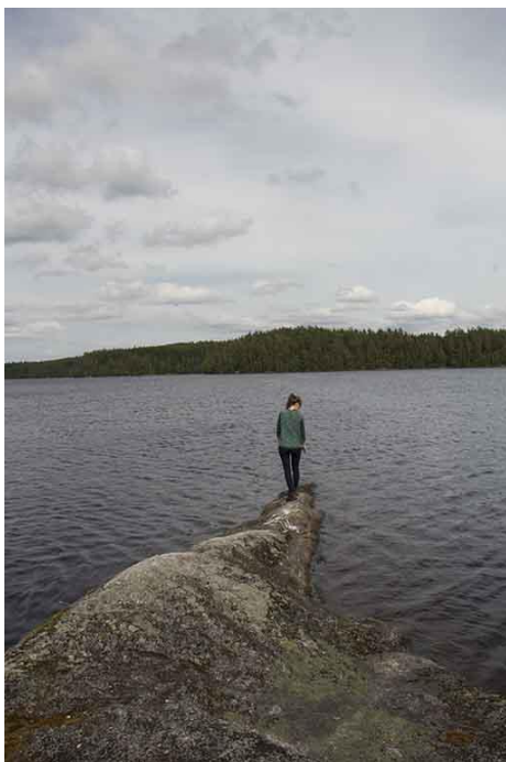
Kuva 4. Niemenkärki.

Näiden lisäksi Heretyn kympin tärkeinä kohteina mainitaan Kannuslahden kotakeittiö, jätkien pyörätien rakennuskuopat, näköalapaikka, kuusikkolehto/puronvarsilehto, Kuoriaisen suokasvillisuus, jää-/tukkitie, vanha pontikankeittopaikka, pitkospuut, Kuorejärven laavu, kaunis näkymä järvelle, kuusikkoa, vihreää sammalta ja aurinkoa yhdistävä päivänsäde ja menninkäinen, hyvä uintipaikka kallioisessa niemenkärjessä, sekä Lortikan kämpä.