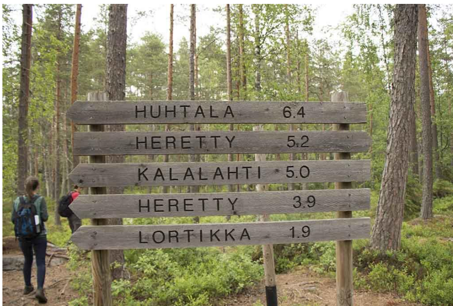
Kuva 2. Opasteita reitillä.

Hankkeeseen valikoidut reitit luokiteltiin käyttäen Outdoors Finland – katto-ohjelman reittiluokittelua, joka ottaa kattavasti huomioon reitin ominaispiirteet, vaativuudet sekä erilaiset aistikokemukset. Lisäksi reittiluokittelun yhteydessä reitin GPS –jälki taltioidaan ja reitin haastavuus merkitään GPS –jälkeen (helppo, keskivaativa, vaativa).