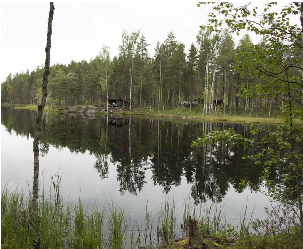
Kuva 8. Laavu.

Pyöräilemisen sallivia reittejä alueella on yli 10 km. ja Pyöräily on sallittu metsäautoteiden lisäksi jätkien tekemällä entisellä pyörätiellä Heretyn ja Lortikan kämppien välillä, sekä Lortikan ja Kalalahden välisellä polulla. Uinti kansallispuiston alueella on sallittua, mutta virallisia uimapaikkoja ei ole.