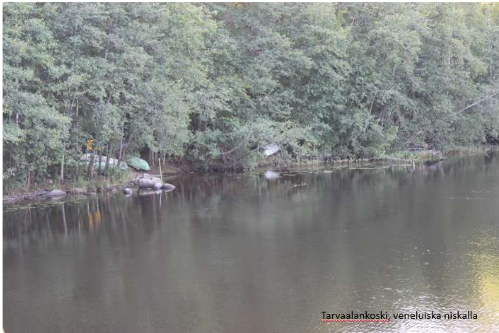
Tarvaalankoski, veneluiska niskalla