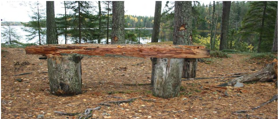
Laho pöytä, poistettava.