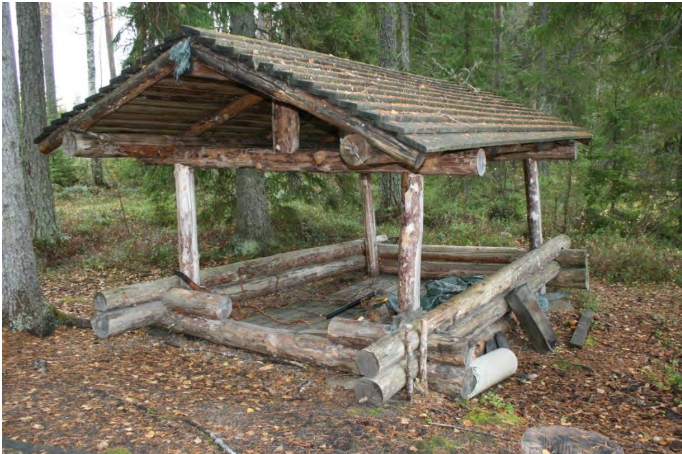
Puukatokseen uusi huopakatto.