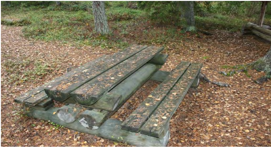
Pöytäryhmä uusittava lähiaikoina.