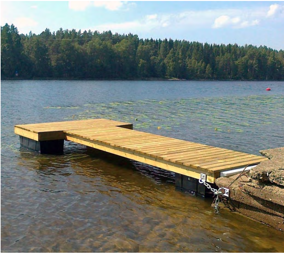
Kuvan tyyppinen laituri sopiva