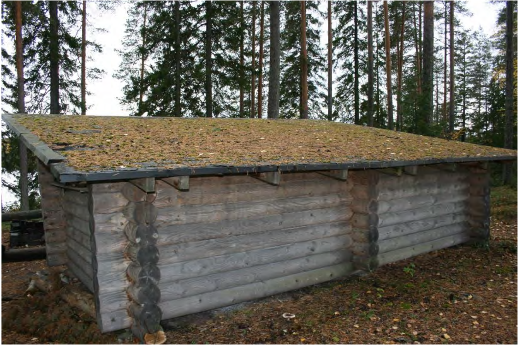
Kattohuopa uusittava. Katon oikeassa sivussa reikä.