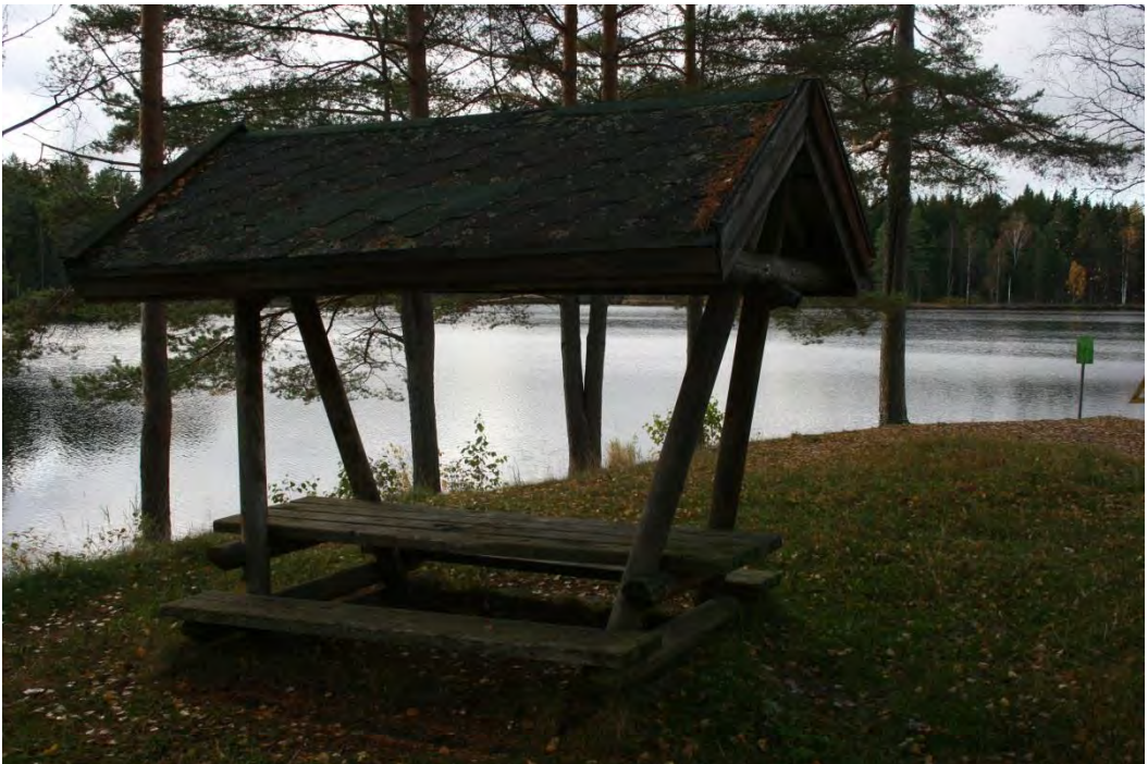
Pöytärakennelma uusittava, samoin huopakatto