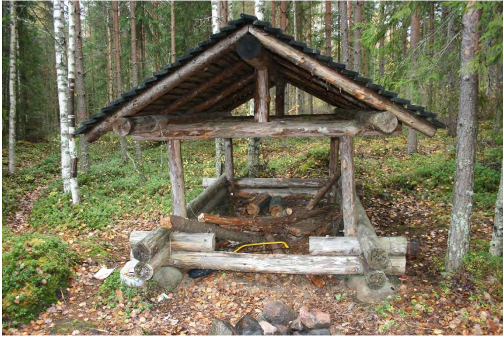
Puukatoksen katto uusittava huopakatoksi.