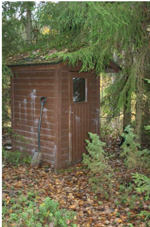
Katon päältä puista poistettava oksat ja katon puhdistus. Kuivikeastia wc:n sisälle.