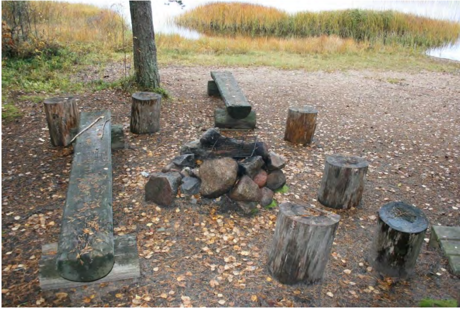
Tulipaikan uusinta kokonaisuudessaan.